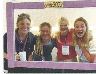
EMTC 2022 · 27