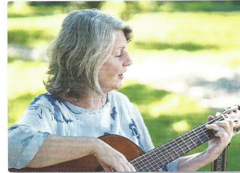
Singende Krankenhäuser · 32