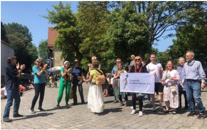
Altstadtsingen in Erfurt

Rund 130 Menschen sind am Pfingstwochenende im einladenden Augustinerkloster Erfurt zusammengekommen, um mehr über das heilsame Singen zu erfahren. In wissenschaftlichen Vorträgen und praktischen Workshops sowie in vielen kleinen Einheiten wie Pausensingen, Zwischentönen oder auch spontan zusammengefundenem Morgen- oder Abendsingen konnten die Teilnehmer singend tagen.