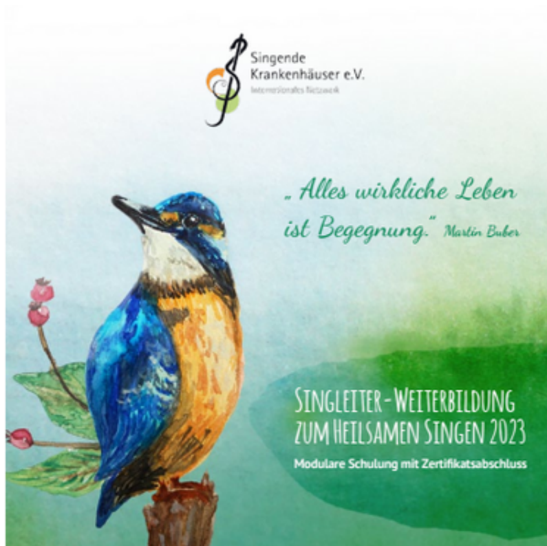
Titelbild des Terminflyers

Wir präsentieren stolz unsere neuen Weiterbildungsbroschüren für die Singleiter-Weiterbildung Pflegeeinrichtungen und Senioren sowie für Krankenhäuser und Gesundheitseinrichtungen . Diesmal gibt es sie auch wieder gedruckt - in kleiner Auflage. Außerdem finden sich alle Termine auf einen Blick in unserem handlichen Flyer , den diesmal ein Eisvogel zierte und somit akustisch und visuell Signale setzt. Link zu Weiterbildung/Info .