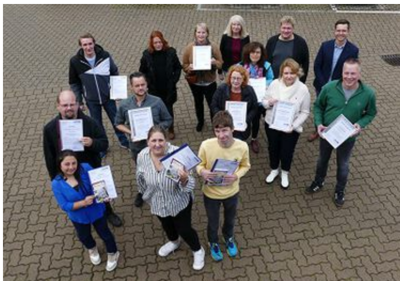
Projektteilnehmer mit Abschlusszertifikaten und Projektverantwortliche

Mit Spannung in den Gesichtern und freudvoller Erwartung wurde ich von acht Teilnehmenden und zwei Verantwortlichen von der diakonischen Stiftung in Minden am 26.09.2022 herzlich begrüßt. Meine eigenen Bedenken, ob ich die Teilnehmer nicht überfordere, schwanden sehr schnell, als ich die offene Bereitschaft erlebte, mit denen bereitwillig die ersten musikalischen Angebote mitgestaltet wurden. Natürlich gab es auch einige, die mit Singen bislang überhaupt nichts zu tun hatten. Doch der ganze Workshop-Tag war trotzdem von einer aufmerksamen und freudvollen Lernatmosphäre geprägt und am Ende des Tages wurde mir versichert, dass sie einiges von dem heute erlebten, ausprobieren wollten.